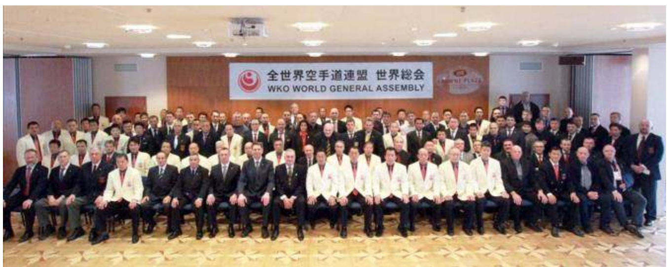
WKO WORLD GENERAL ASSEMBLY 2013 DI VILNIUS – LITHUANIA