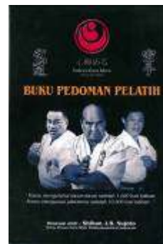
Buku Pedoma Pelatih Rp.50.000,-