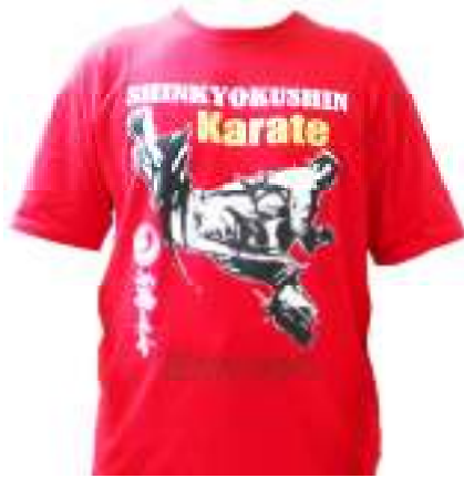
Kaos Shinkyokushin Rp. 120.000,- Bahan cotton