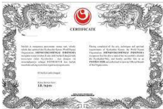
Sertifikat Instruktur WKO-Shinkyokushinkai Rp.100.000,-

Sabuk Hitam - Rp.120.000,- Bagi yang mau mengganti sabuk hitam dengan logo Shinkyokushin dan tulisan WKO Shinkyokushinkai (huruf kanji) disabuk, dapat mengajukan . Khusus bagi mereka yang belum mendaftarkan tingkatannya ke So-Honbu.