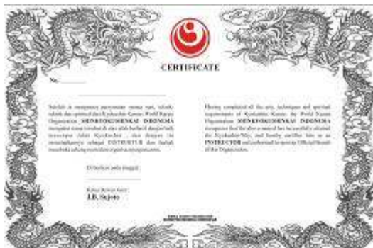
Sertifikat Instruktur WKO-Shinkyokushinkai Rp.150.000,-

Sabuk Hitam - Rp.120.000,- Bagi yang mau mengganti sabuk hitam dengan logo Shinkyokushin dan tulisan WKO Shinkyokushinkai (huruf kanji) disabuk, dapat mengajukan . Khusus bagi mereka yang belum mendaftarkan tingkatannya ke So-Honbu.