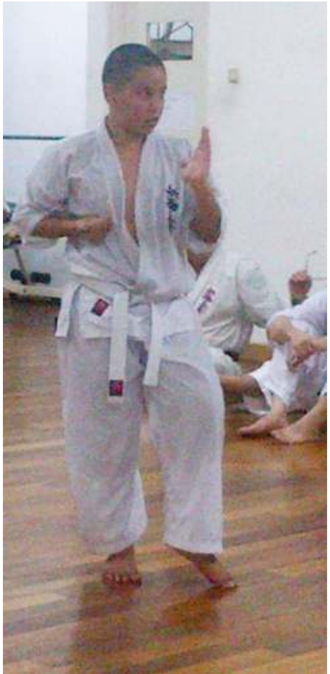
Latihan yang dimulai sejak usia muda pasti akan terbentuk lebih baik dan lebih sempurna .