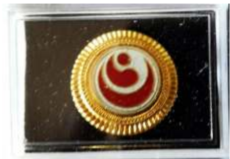
Pin WKO Indonesia Rp.100.000,- Dengan magnet