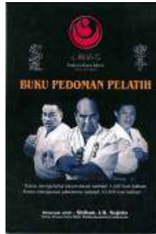
Buku Pedoma Pelatih Rp.100.000,-