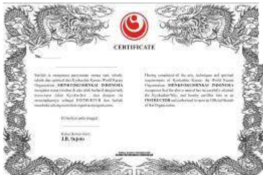
Sertifikat Instruktur WKO-Shinkyokushinkai Rp.150.000,-

Sabuk Hitam - Rp.150.000,- Bagi yang mau mengganti sabuk hitam dengan logo Shinkyokushin dan tulisan WKO Shinkyokushinkai (huruf kanji) disabuk, dapat mengajukan . Khusus bagi mereka yang belum mendaftarkan tingkatannya ke So-Honbu.