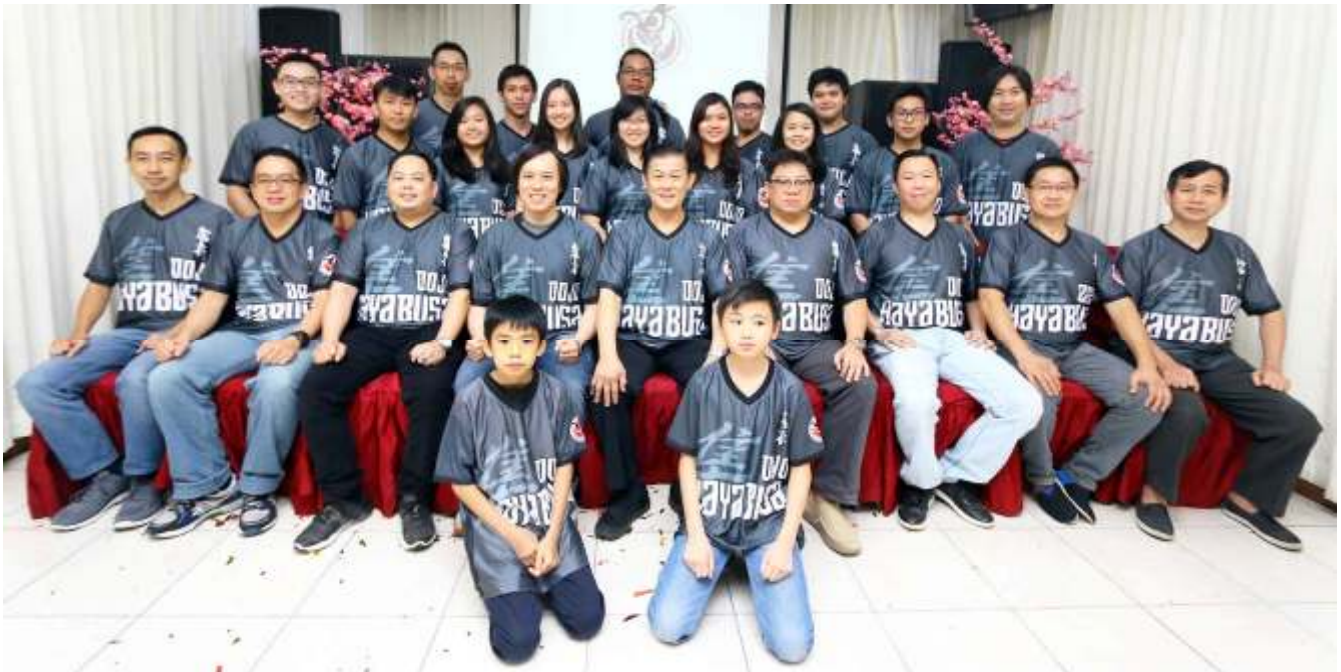
Wajah – wajah anggota dojo Hayabusa , Jakarta