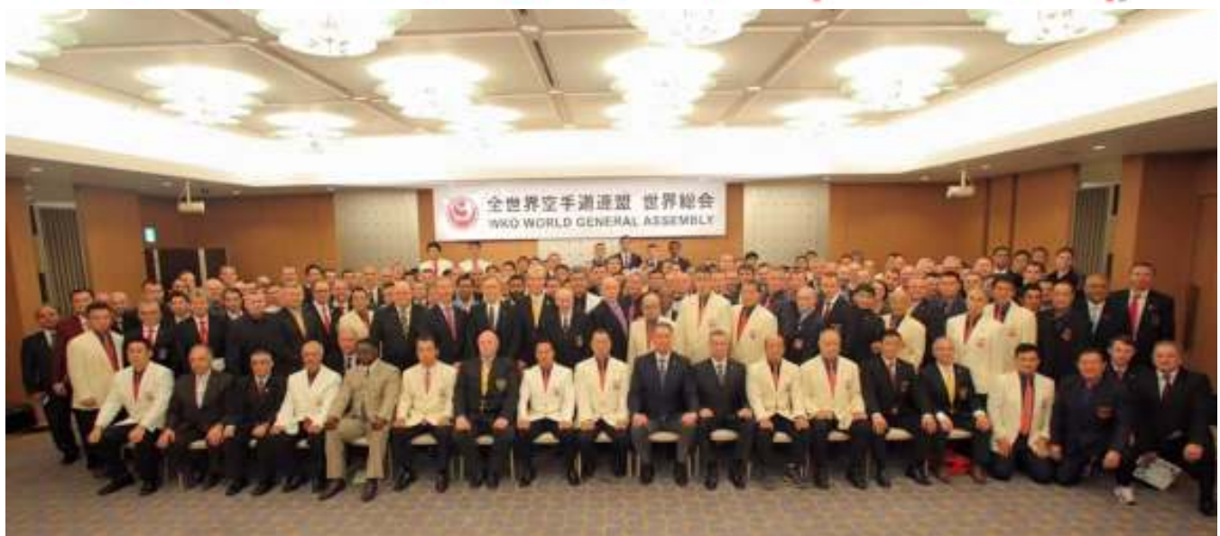
WORLD GENERAL ASSEMBLY 2015 DI TOKYO-JAPAN