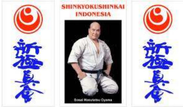
Harga untuk 3 banner Rp.450.000,- Pasang didalam dojo anda