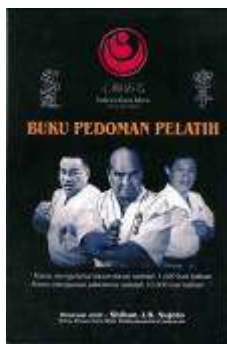
Buku Pedoma Pelatih Rp.100.000,-

“ Shinkyokushinkai no uta “ dikarang & dinyanyikan oleh : Tsuyoshi Nagabuchi ( Tsuyoshi Nagabuchi adalah seorang penyanyi terkenal di Jepang & di samping itu juga sebagai anggota Shinkyokushinkai .)