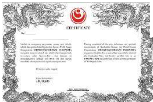
Sertifikat Instruktur WKO-Shinkyokushinkai Rp.150.000,-

Sabuk Hitam - Rp.150.000,- Bagi yang mau mengganti sabuk hitam dengan logo Shinkyokushin dan tulisan WKO Shinkyokushinkai (huruf kanji) disabuk, dapat mengajukan . Khusus bagi mereka yang belum mendaftarkan tingkatannya ke So-Honbu.