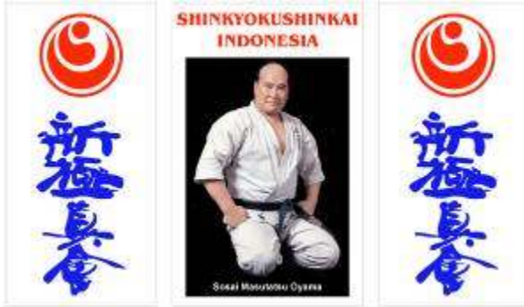
Harga untuk 3 banner Rp.450.000,- Pasang didalam dojo anda