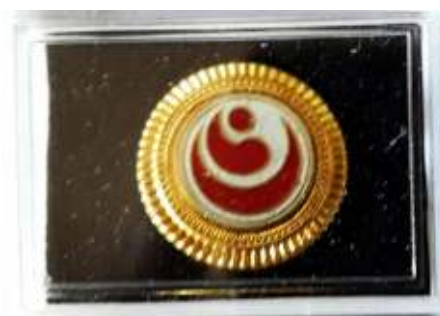
Pin WKO Indonesia Rp.100.000,- Dengan magnet