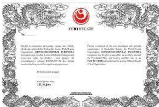
Sertifikat Instruktur WKO-Shinkyokushinkai Rp.150.000,-

Sabuk Hitam - Rp.120.000,- Bagi yang mau mengganti sabuk hitam dengan logo Shinkyokushin dan tulisan WKO Shinkyokushinkai (huruf kanji) disabuk, dapat mengajukan . Khusus bagi mereka yang belum mendaftarkan tingkatannya ke So-Honbu.