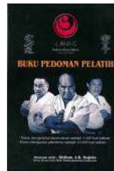
Buku Pedoma Pelatih Rp.50.000,-