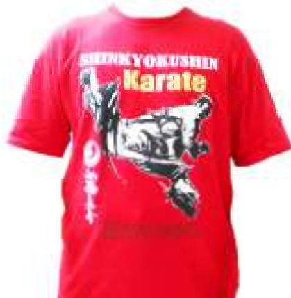
Kaos Shinkyokushin Rp. 120.000,- Bahan cotton

Buku Seri Kihon Rp.40.000,- Ongkos kirim : Tanyakan dulu