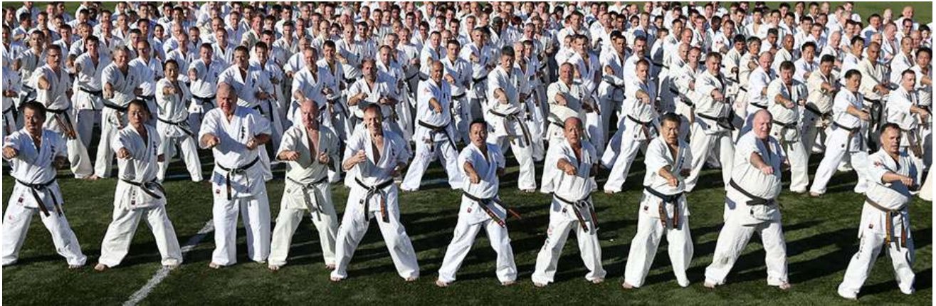
World Karate Seminar 2015 in Fujiyama Sekitar 400 orang lebih mengambil bagian .

“ Meskipun penting untuk mempelajari dan melatih keterampilan teknik , bagi orang yang berkeinginan mencapai Jalan Budo secara benar , adalah penting terus menjalankan latihan sepanjang hidupnya , dan tidak hanya semata-mata ditujukan pada keterampilan dan kekuatan , tetapi juga untuk pencapaian kesempurnaan dalam spiritual “. ( Masutatsu Oyama )