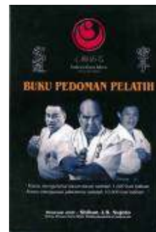
Buku Pedoma Pelatih Rp.100.000,-