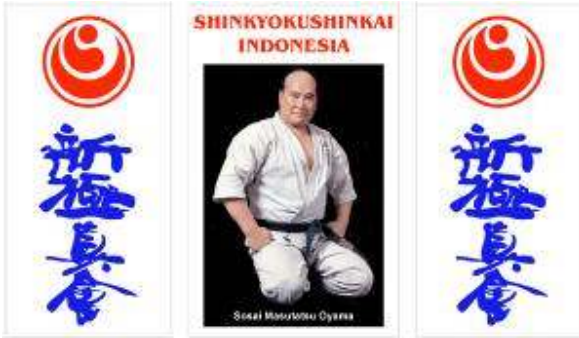
Harga untuk 3 banner Rp.450.000,- Pasang didalam dojo anda