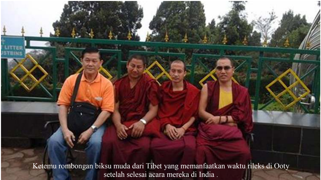
Ketemu rombongan biksu muda dari Tibet yang memanfaatkan waktu rileks di Ooty setelah selesai acara mereka di India .

Tanggal 16 Desember 2015 menuju Trivandrum , Kerala via Bengaluru . Tiba di sana sudah malam . Keesokan hari membantu mereka mempersiapkan Kejuaraan Daerah Kerala ke-1 . Tanggal 18 Desember 2015 dimulai dengan babak penyisihan hingga sore . Keesokan dilaksanakan ujian dan latihan . Sore hari pertandingan diteruskan dengan babak selanjutnya hingga selesai sekitar pukul 20.00 .