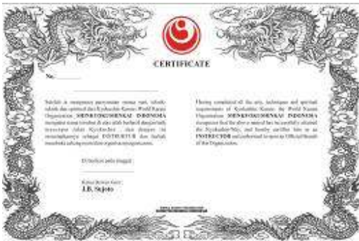
Sertifikat Instruktur WKO-Shinkyokushinkai Rp.150.000,-

Sabuk Hitam - Rp.120.000,- Bagi yang mau mengganti sabuk hitam dengan logo Shinkyokushin dan tulisan WKO Shinkyokushinkai (huruf kanji) disabuk, dapat mengajukan . Khusus bagi mereka yang belum mendaftarkan tingkatannya ke So-Honbu.