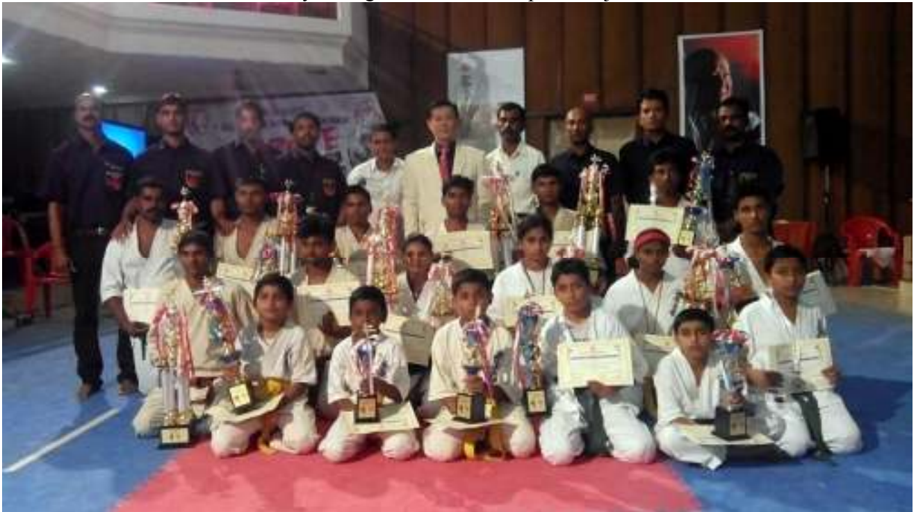
Para pemenang Kejuaraan Daerah Kerala ke-1