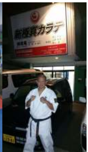
Bersama putra shihan Midori yang berhasil menjadi juara di pertandingan yang diadakan KWU di Rusia