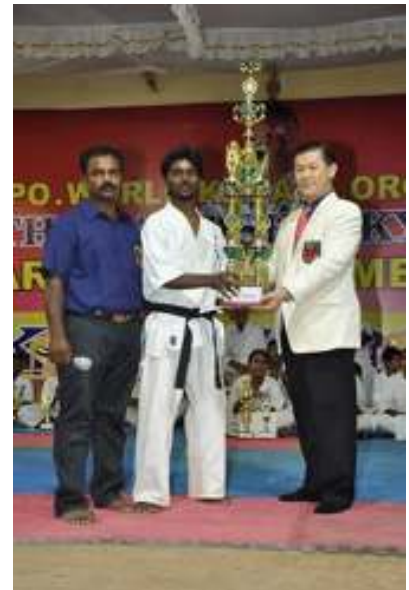
Para pemenang Kejuaraan Daerah Tamilnadu ke-12