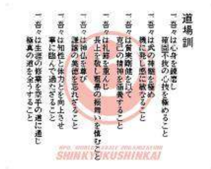
Dojo Kun Huruf Kanji & Indonesia Ukuran : 50 cm x 40 cm Rp.150.000,- (utk 2 banner)