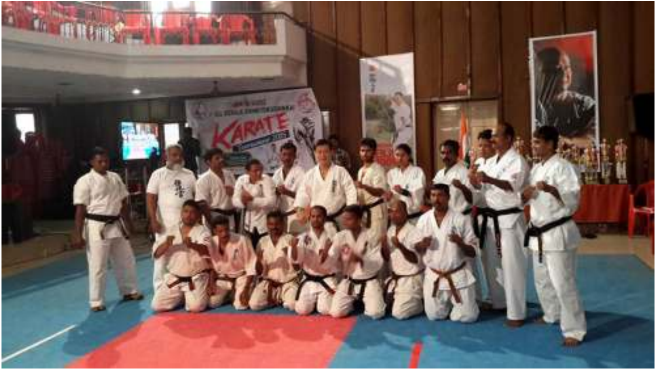
Penyandang sabuk hitam dan peserta ujian