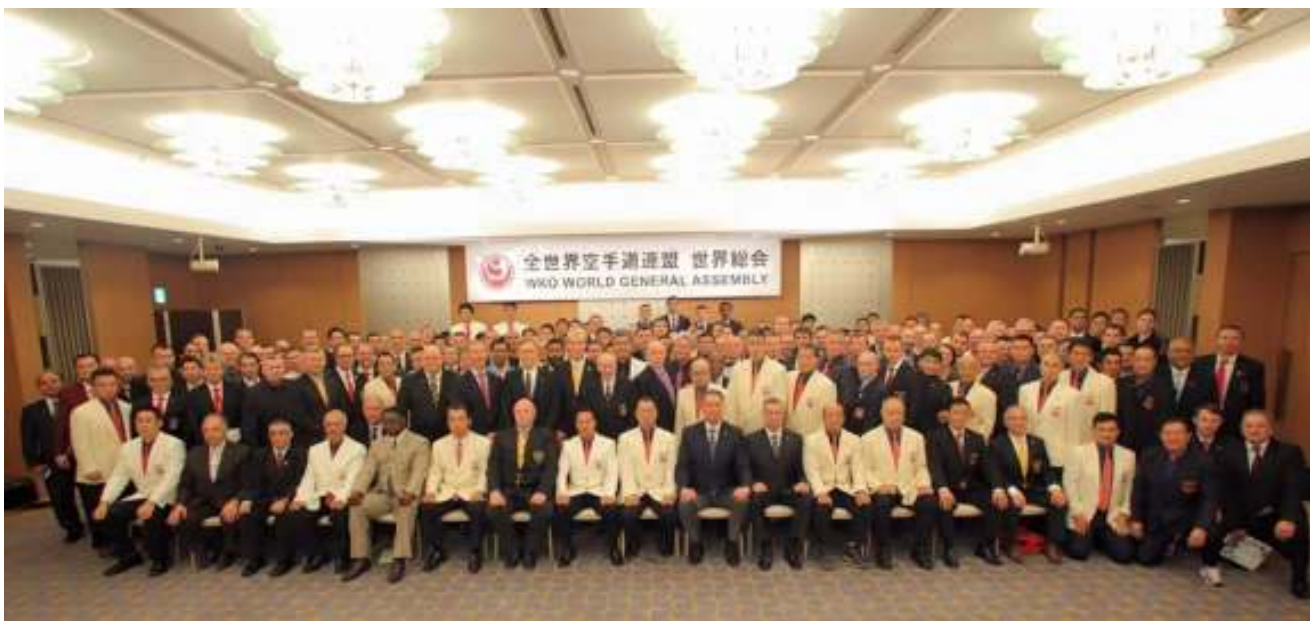
WKO WORLD GENERAL ASSEMBLY 2015 DI TOKYO-JAPAN