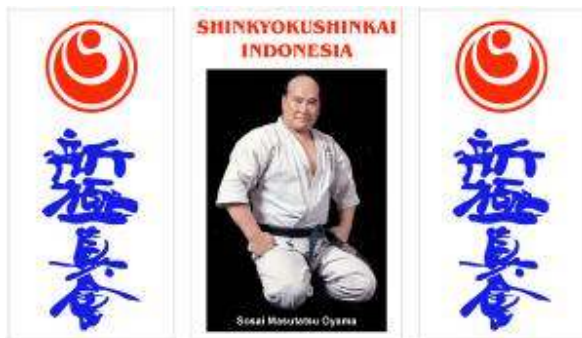
Harga untuk 3 banner Rp.450.000,- Pasang didalam dojo anda