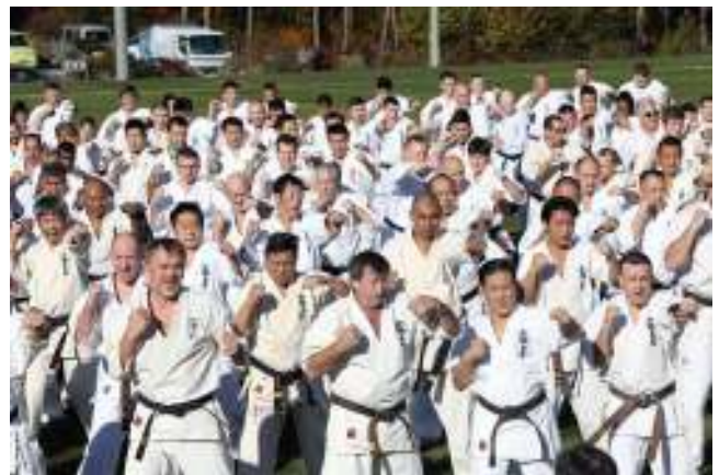
Semua melakukan latihan kihon secara bersama tanpa memandang usia dengan penuh antusias . Meskipun lelah , tetap bertahan hingga selesai .