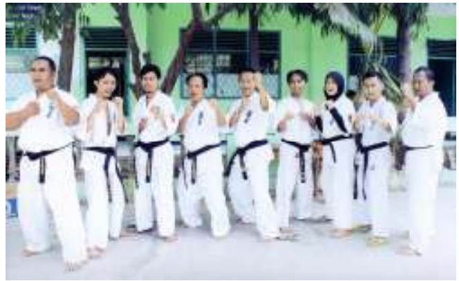
Para Pelatih Jabar tetap kompak dan bahkan semakin bertambah personilnya .