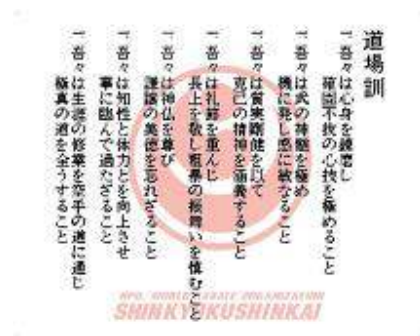
Dojo Kun Huruf Kanji & Indonesia Ukuran : 50 cm x 40 cm Rp.150.000,- (utk 2 banner)