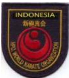
Badge utk Jas berwarna krem Rp.15.000,-