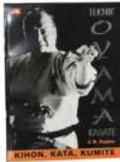
Buku Teknik Oyama Karate (Kihon-Kata-Kumite) Rp.150.000,-