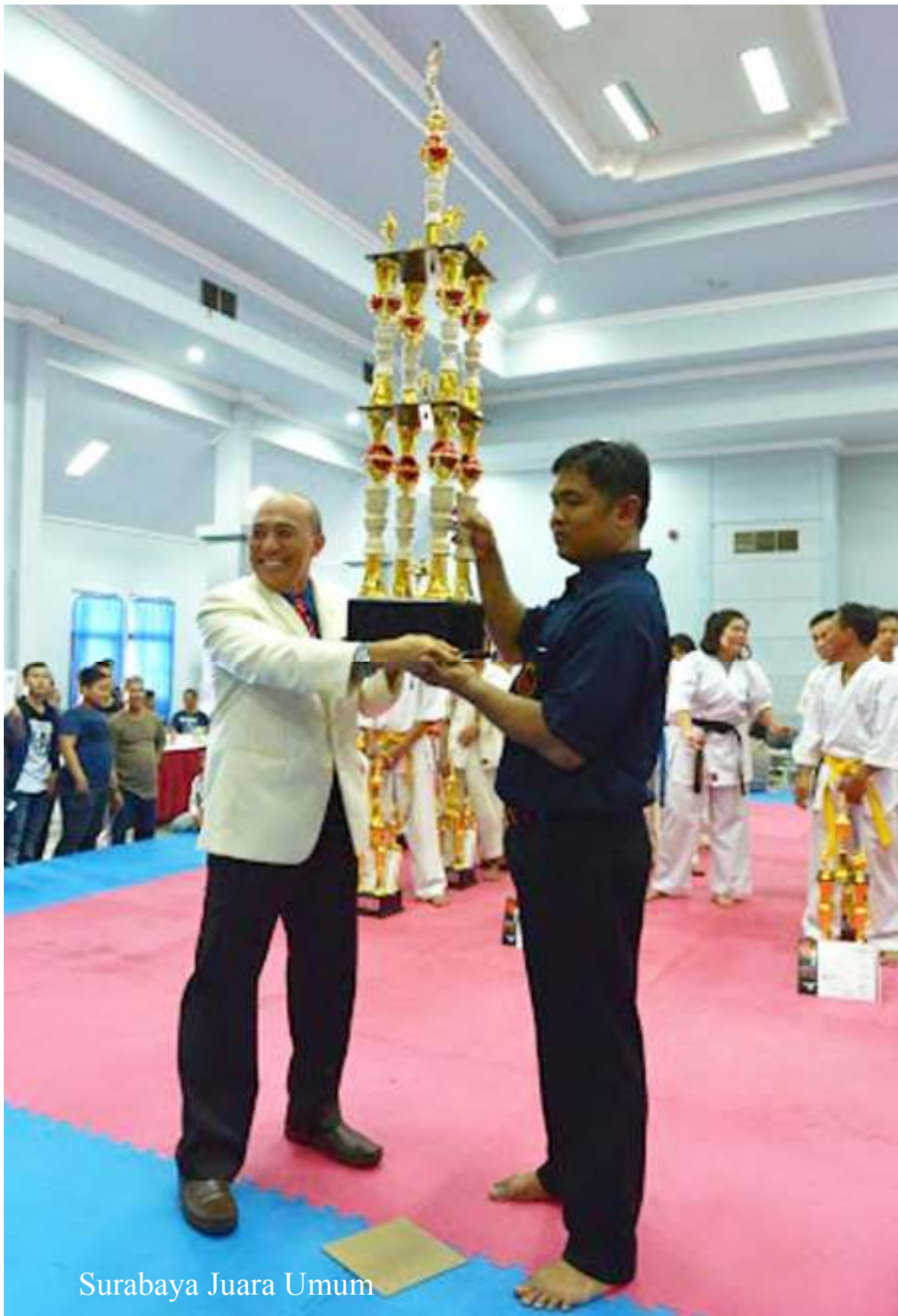
Surabaya Juara Umum