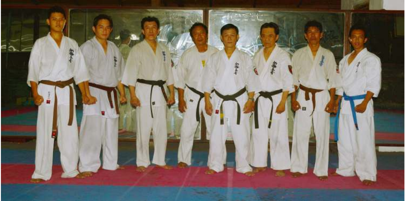
Latihan bersama di dojo Denpasar

Setelah daya tahan meningkat bukan berarti harus membiarkan diri menerima setiap serangan lawan meskipun kuat . Sedapat mungkin menghindar dari kontak dengan serangan lawan , namun apabila terkena serangan, tidak mudah menyerah begitu saja . Berlatih lah terus hingga anda mencapai potensi yang ada dalam diri anda semaksimal mungkin . Manfaatkan setiap kesempatan yang ada untuk menyempurnakan kualitas Anda secara keseluruhan.