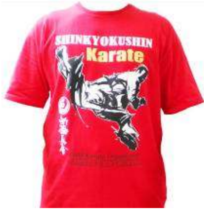
Kaos Shinkyokushin Rp. 120.000,- Bahan cotton

Buku Seri Kihon Rp.40.000,- Ongkos kirim : Tanyakan dulu