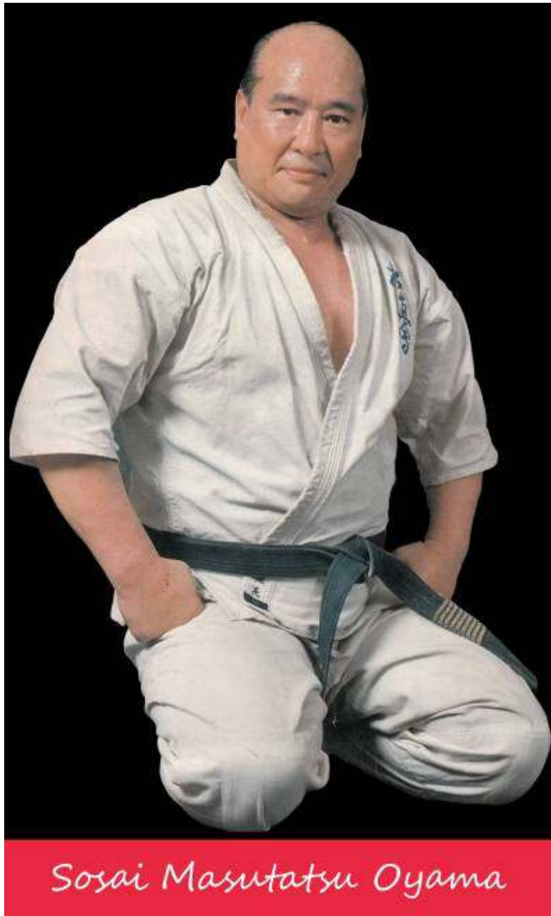
SOSAI MASUTATSU OYAMA'S DEATH ( 1994 – 2014 )